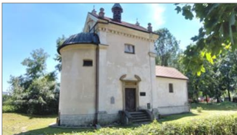
Kościółek św. Bartłomieja - bryła

Kolejnym trudnym do realizacji zagadnieniem jest nałożenie na Parafię postanowienia Wojewódzkiego Konserwatora Zabytków przeprowadzenia rewaloryzacji i odnowy